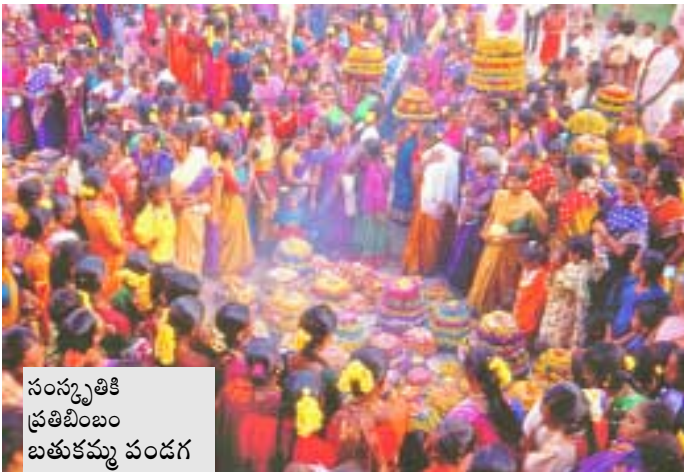
సంస్కృతికి ప్రతిబింబం బతుకమ్మ పండగ

పత్రికలు ఎన్నో వచ్చాయి. పుస్తకాలు ఎన్నో వచ్చాయి. ఈవిధంగా తెలంగాణ చరిత్రని పునర్నిశ్చేషించుకోవడం వల్ల తెలంగాణ ప్రత్యేకత మరింతగా లోకానికి వెల్లడవుతుంది.